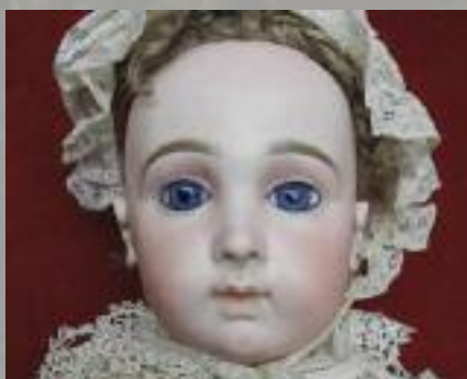
Superbe bébé JUMENTAU Triste tête en biscuit pressé Marque au tampon bleu dans le dos : " JUMENTAU MEDAILLE D'OR PARIS " H. 82 cm