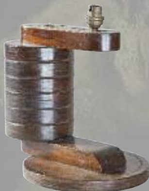
André SORNAY. Lampe en bois teinté, base ronde cloutée. H. 30 cm