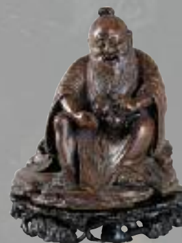
GRUPE en bois sculpté en ronde-bosse à décor d'un moine assis tenant des grenades. Chine. Epoque XIX e siècle. 16,5 x 14 x 15 cm