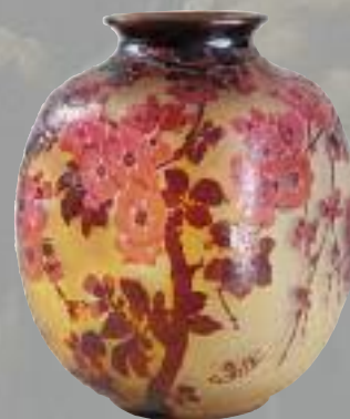
Émile GALLÉ. Vase pansu en verre à décor de pommeries du Japon. Signé. H. 28,5 cm