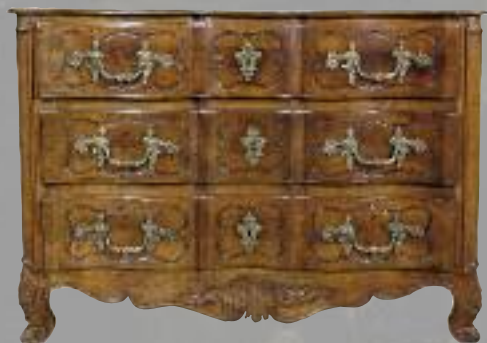
COMMODE en noyer mouluré et sculpté, garniture de bronzes dorés au chinois. Travail lyonnais d'époque Louis XV. 91 x 128 x 66 cm.