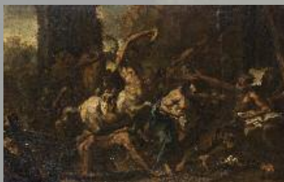
Alessandro MAGNASCO (Gênes 1667-1749) La tentation de Saint-Antoine Huile sur toile, 63 x 97 cm.