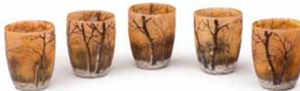
DAUM Série de cinq vases en verre gravé et émaillé. H. 4,5 cm 2 500 / 3 000 €