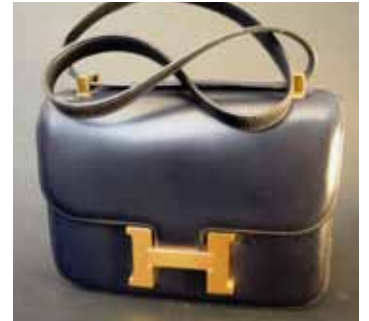
HERMES Paris made in France Sac Constance en cuir marine. 800 / 1 200 €