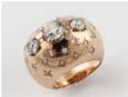
BAGUE jonc or diamants taille ancienne env. 1,80 cts 1 500 / 1 700 €