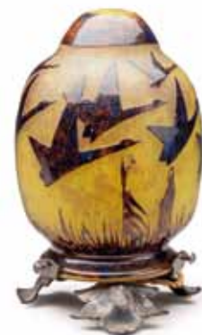
LE VERRE FRANÇAIS Vieilleuse «Halbrans» en verre gravé. H. 17 cm 300 / 400 €