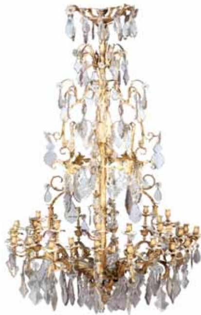
LUSTRE cage en bronze doré éclairant anciennement à trente-six feux, belle et riche ornementation de cristaux facettés. Époque XIX e siècle. H. 220 cm, D. 140 cm. Electrifié 5 000 / 6 000 €