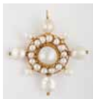
PENDENTIF or perles fines pour 4,76cts. Certificat SSEF. 2 000 / 2 500 €