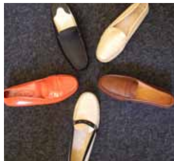
TOD'S Cinq paires de mocassins. 150 / 180 €