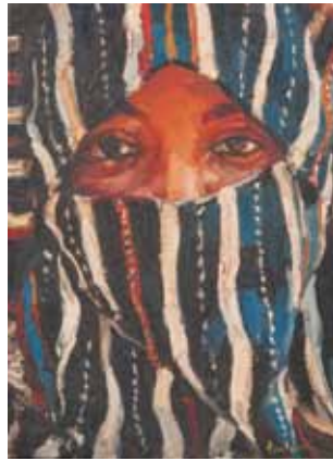
Léon LURET (?-1969) Mauresque HST SBD. 40 x 29 cm 600 / 800 €