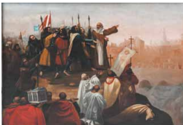
ÉCOLE FRANÇAISE du XIX e siècle

Torrent à travers les arbres avec personnage HST SBD. 92 x 73 cm 800 / 1 200 €