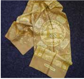
HERMES Paris Écharpe en soie imprimée. 100 / 120 €