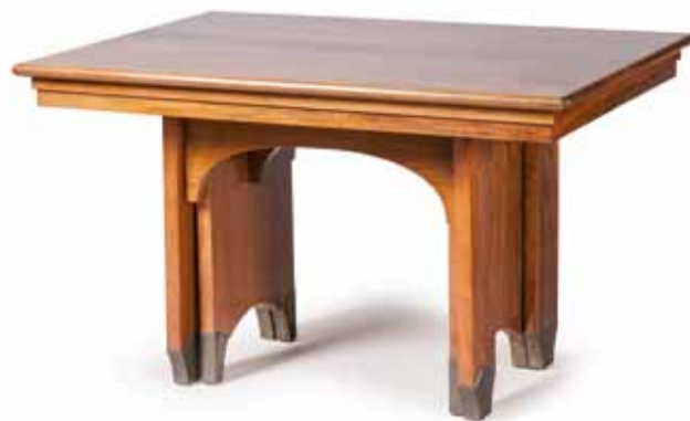
Eugène PRINTZ (1889-1948) Table de salle à manger en placage de noyer. Signée. 72 x 125 x 90 cm 4 000 / 6 000 €