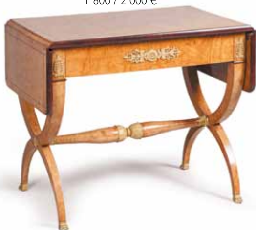
TABLE à volets en placage de loupe d'orme et acajou.