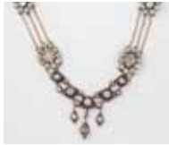
COLLIER provençal or argent cristal de roche. XIX e siècle. 200 / 250 €