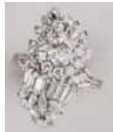
BAGUE or et platine diamant demi-taille env. 0,50 ct 1 200 / 1 500 €