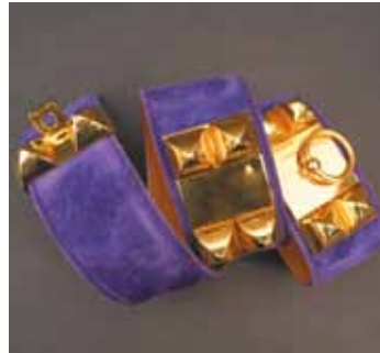
HERMES Paris made in France Ceinture Médor en daim violet et laiton doré. 250 / 350 €