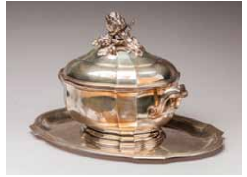
LÉGUMIER couvert et son présentoir en argent ciselé. M.O. : TÉTARD FRÈRES, marqués FOU-QUET-LAPAR Paris. Légumier : 22 x 27 cm, présentoir : 36 x 23 cm, 2240 g 600 / 800 €