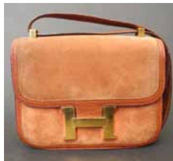
HERMES Paris Sac Constance en daim et cuir. 500 / 600 €