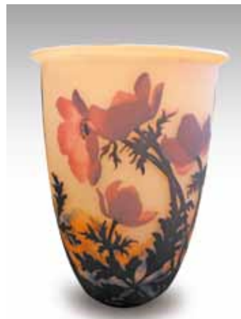
MULLER frères Vase de forme ouverte en verre gravé à décor polychrome d'anémones. H. 25 cm 1 500 / 2 000 €