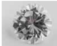
DIAMANT taille brillant non monté pesant 1,43 cts supposé VS, G 5 000 / 5 500 €