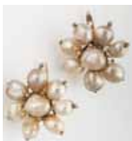
PENDANTS d'oreilles or perles fines. Certificat SSEF. 3 000 / 5 000 €