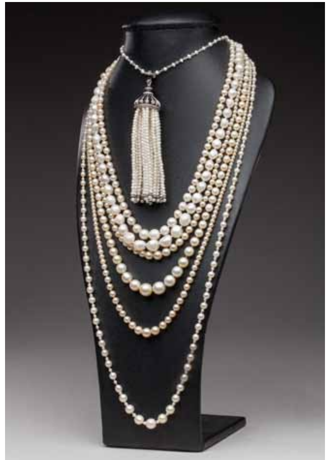
SAUTOIR or perles diamants cognac onyx. Style Art Déco. L. 90,3 cm. 800 / 1 200 € ■ COLLIER 57 perles fines, diam. 5,15 à 8,30 mm. Certificat SSEF. 4 000 / 5 000 € ■ COLLIER 87 perles fines, diam. 2,55 à 7,60 mm. Certificat SSEF. 6 000 / 7 000 € ■ COLLIER 129 perles fines diam 1,5 à 6 mm. Certificat LFG. 2 500 / 3 500 € ■ COLLIER 99 perles fines diam. 2,5 à 6,7 mm. Certificat LFG. 2 500 / 3 500 € ■ COLLIER 84 perles fines. Diam. 3,2 à 8,3 mm. Certificat LFG. 5 000 / 10 000 € ■ COLLIER 185 perles fines, diam. 2 à 6,1 mm. Certificat LFG. 6 000 / 8 000 €