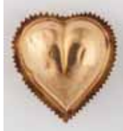
COULANT cœur or. Savoie, du XIX e siècle 150 / 250 €