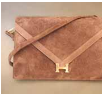
HERMES Paris made in France Sac en daim marron de forme enveloppe. 400 / 600 €