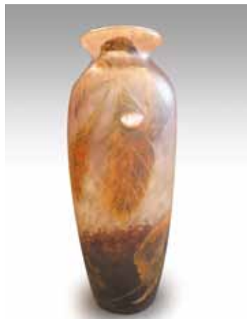
MULLER frères Vase cylindrique en verre gravé de feuilles d'automne avec un coléoptère en application. H. 21 cm 1 000 / 1 200 €