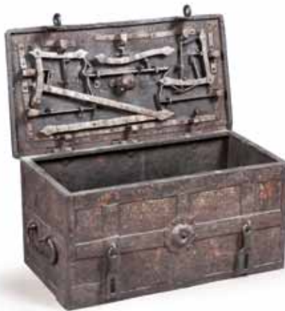
COFFRE en fer forgé à décor laqué de fleurs. Nuremberg, époque fin XV e - début XVI e siècle. 36 x 75 x 40 cm. LF 2 500 / 3 500 €