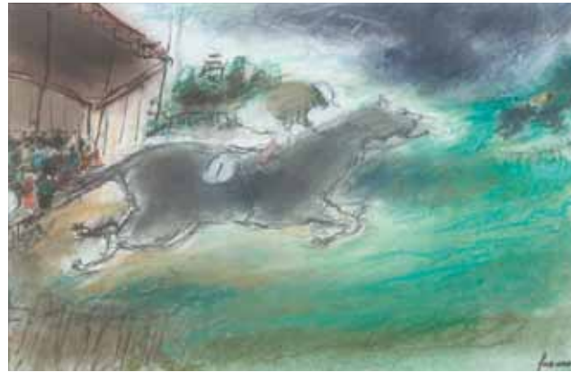
Jean FUSARO (1925-) Le cheval de course Fusain et pastel sur papier SBD. 31,5 x 48 cm 800 / 1 000 €