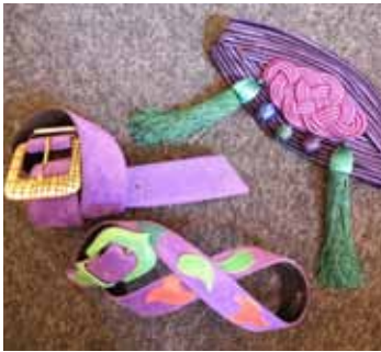
Yves SAINT LAURENT rive gauche Lot de deux ceintures en daim et une en passementerie. 120 / 150 €