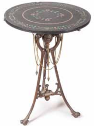
GUÉRIDON à plateau en pietra dura à décor de frises, piètement zoomorphe en fonte. Époque XIX e siècle. H. 82, D. 59 cm 2 500 / 2 800 €