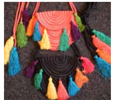
Yves SAINT LAURENT rive gauche Lot de deux sacs en passementerie à pompons multicolores. 200 / 300 €