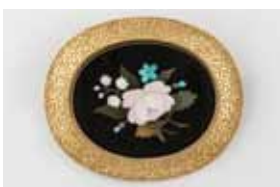
BROCHE en or. Marqueterie de pierres dures 300 / 500 €