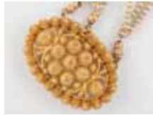
2 BRACELETS fermoirs or. Époque Charles X. 300 / 350 €