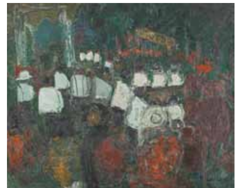
Jean FUSARO (1925-) Foire aux bœufs, 1962 HST SBD. 54 x 65 cm 1 500 / 2 000 €