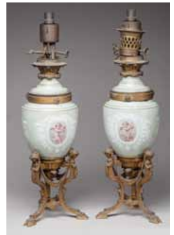
Paire de LAMPES à PÉTROLE en porcelaine céladon et bronze doré. Époque seconde moitié du XIX e siècle. H. 54 cm 400 / 600 €