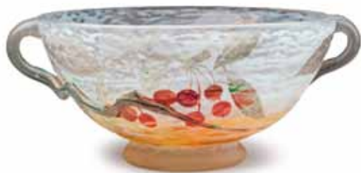
DAUM Coupe en verre gravé à décor de pampres rouges en application. H. 12 cm D. 31 cm 1 500 / 2 000 €