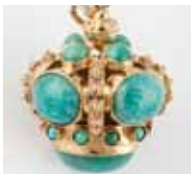
PENDENTIF or et amazonite. 450 / 550 €