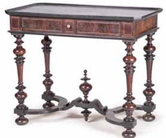
TABLE en noyer et bois noirci. Époque Louis XIV. 84 x 102 x 56 cm 2 200 / 2 400 €