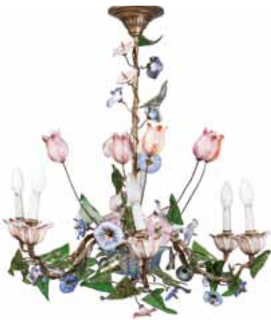
LUSTRE en bronze doré éclairant à six lumières à décor de tulipes et liserons. Époque Napoléon III. H. 85 cm, D. 78 cm 800 / 1 200 €