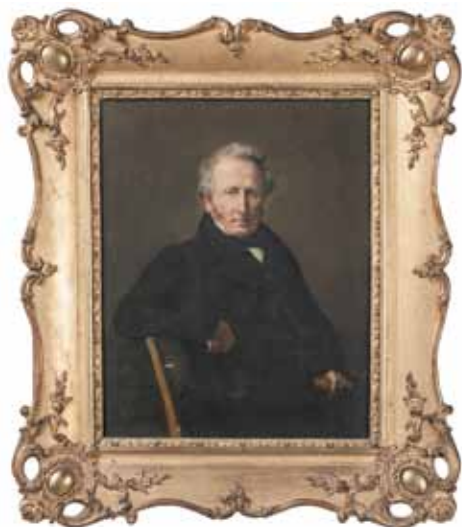
Hippolyte Jean FLANDRIN (1809-1864)

Portrait d'un homme assis, 1835 HST SBG. 44 x 33 cm 600 / 800 €