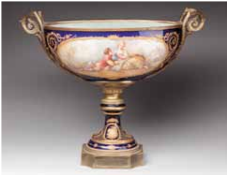
COUPE en porcelaine dans le goût de Sèvres. Monture en bronze doré. Époque seconde moitié du XIX e siècle. 35 x 47 cm 300 / 400 €