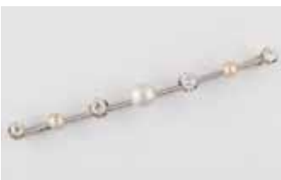
BROCHE platine perle fine de 2,65 cts (certificat GGTL), 2 perles, diamants env. 1 ct 350 / 450 €