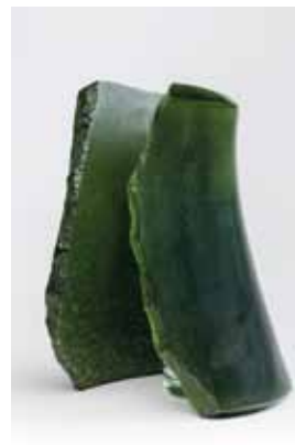
DAUM Vase dans une lame de pâte de verre. H. 35 cm 600 / 700 €