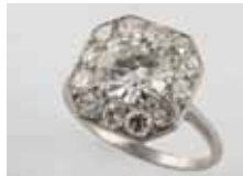
BAGUE platine diamant demi taille 2,30 cts entouré diamants 1,50 cts 10 000 / 15 000 €