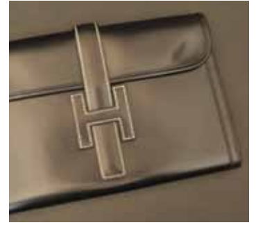
HERMES Paris made in France. Pochette «Jige» cuir noir à surpiqûres. 700 / 900 €