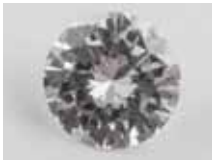
DIAMANT taille brillant non monté pesant 1,28 cts supposé VVS, G 4 200 / 4 500 €