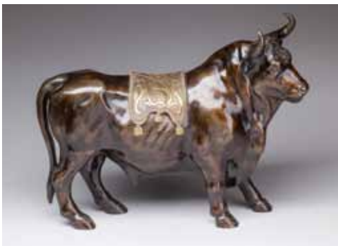
ÉCOLE FRANÇAISE du XVIII e siècle Taureau caparaçonné. Sculpture en bronze patiné et doré. 29 x 39 cm 2 000 / 3 000 €