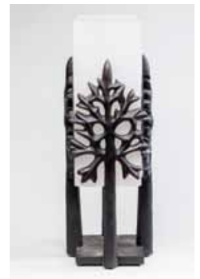
DAUM / Eric GIZARD Lampe « Arabesque » en pâte de verre. H. 43 cm 900 / 1 000 €