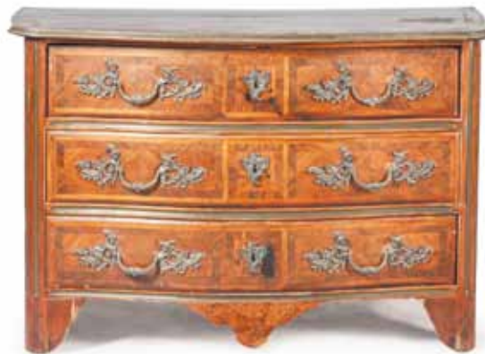
COMMODE à façade galbée en placage de bois de rose, bronzes dorés à têtes d'Indiens. Époque Louis XIV. 85 x 130 x 70 cm 3 500 / 4 500 €