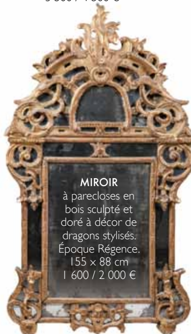
MIROIR à parecloses en bois sculpté et doré à décor de dragons stylisés. Époque Régence. 155 x 88 cm 1 600 / 2 000 €