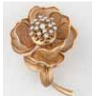
BROCHE rose or; pétales articulés, diamants. Vers 1950 700 / 800 €