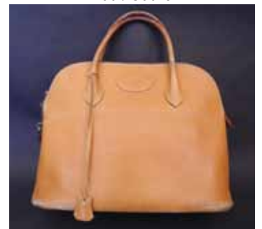
HERMES Paris made in France Sac bolide en cuir grainé beige. 300 / 400 €