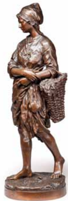
Jean-Baptiste CARPEAUX (1827-1875) La pêcheuse de vignots Bronze à patine brune. H. 73 cm 3 000 / 4 000 €