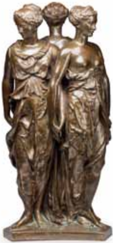
Louis VISCONTI (1791-1853), d'après Les trois Grâces Sculpture en bronze patiné. H. 60 cm 1 300 / 1 500 €