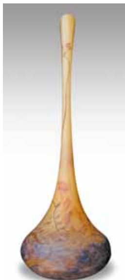
MULLER frères Vase soliflore à pied arrondi en verre gravé et émaillé à décor floral. H. 54 cm 1 000 / 1 200 €