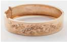
BRACELET semi rigide 13 perles fines. 400 €