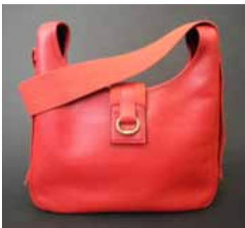
HERMES Paris made in France Sac en cuir grainé rouge. 400 / 500 €