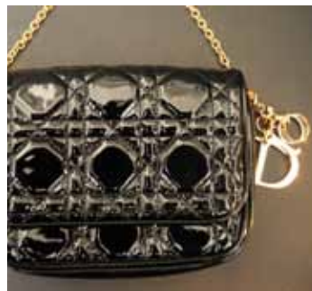
Christian DIOR Petit sac en cuir vernis noir canevas. 120 / 150 €