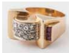
BAGUE Tank or et diamants. Vers 1940. 500 / 800 €