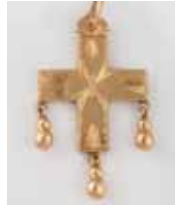
CROIX du Beaufortain or. XIX e siècle 500 / 1 000 €