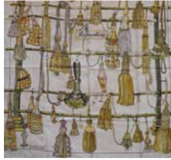
HERMES Paris Carré en soie imprimée titré «Passenterie». 80 / 100 €