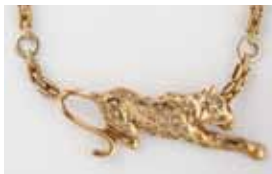
COLLIER panthère or et diamants. 700 / 800 €