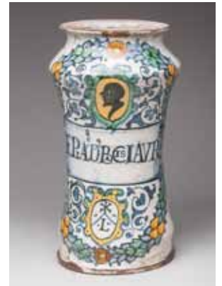
ITALIE. ALBARELLO en faïence à décor polychrome. Daté au dos 1561. Époque XVI e siècle. H. 23 cm 500 / 800 €