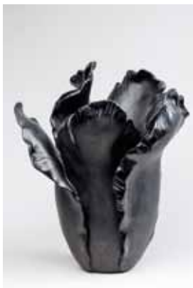
DAUM Vase « Tulipe » en pâte de cristal. H. 33 cm 500 / 600 €