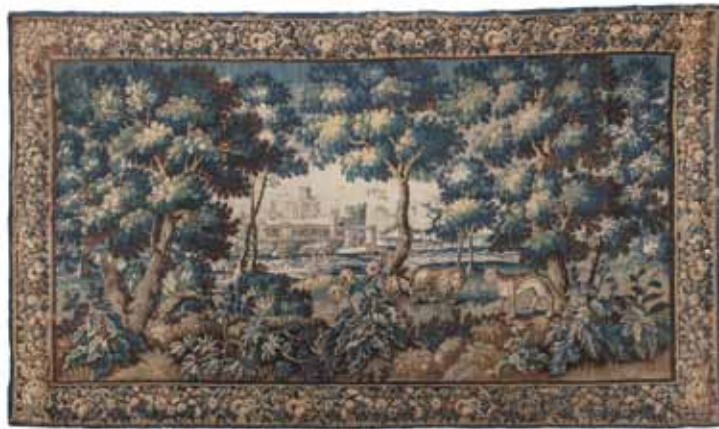
AUBUSSON TAPISSERIE à décor de château, lion et tigre sur fond de verdure. Époque seconde moitié du XVII e siècle. 296 x 494 cm 2 500 / 3 500 €