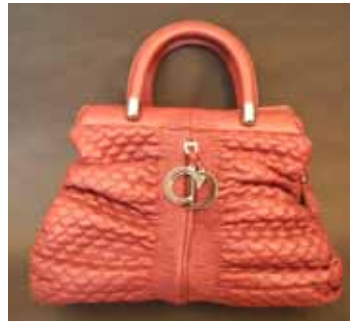
Christian DIOR Sac en cuir à effet nids d'abeille rouge. 700 / 1 000 €