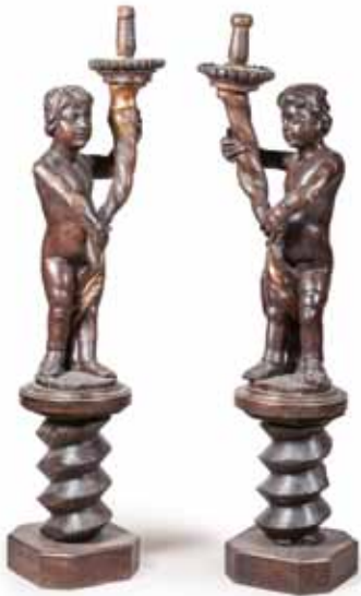
Paire de TORCHERES en bois naturel à décor de deux putti tenant des cornes d'abondance. Époque début XVIII e siècle. 159 x 35 x 37 cm 1 200 / 1 800 €