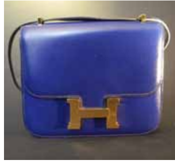
HERMES Paris made in France Sac Constance en cuir bleu. 800 / 900 €