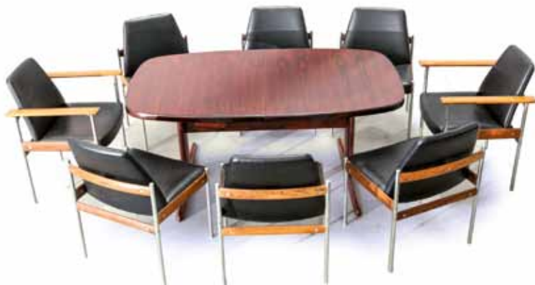
Skovby MÖBEL Table de salle à manger en palissandre. 73 x 165 x 100 cm 300 / 400 €