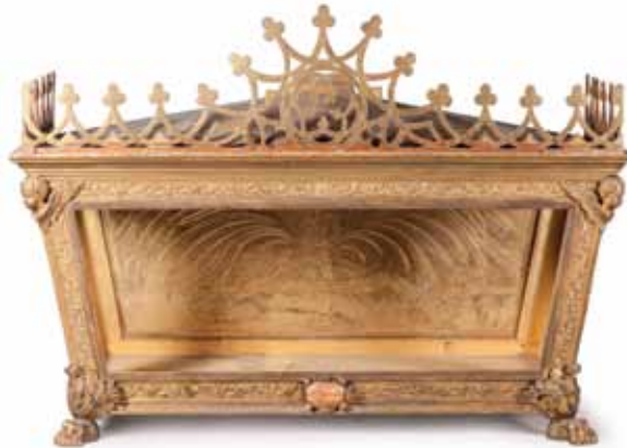
CHASSE en bois doré et sculpté de feuillage, enroulement et tête de chérubin. Le phylactère central porte la mention : «Corps de Saint Prissilien Martyr». Époque XIX e siècle. 146 x 205 x 79 cm 500 / 800 €