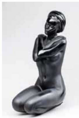
DAUM et DEVILLE-CHABROL Eurydice Sculpture en pâte de cristal noire. H. 44 cm 1 500 / 2 000 €