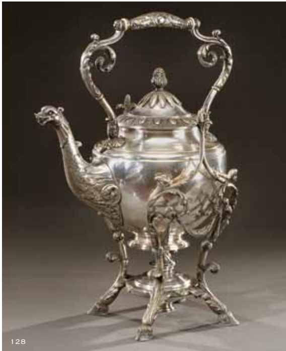
128 SAMOVAR en bronze et laiton argenté orné de feuillages, tête d'oiseau et pieds de biche.

Marqué : I 69, poinçon C tête de cheval, H Ralphen dans un carré.