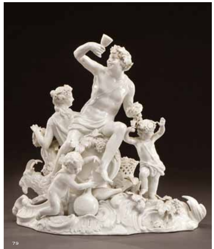
Illustration page 12