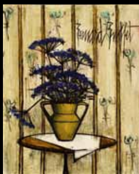
Bernard Buffet (1928-1999) Ombelles bleues dans un vase