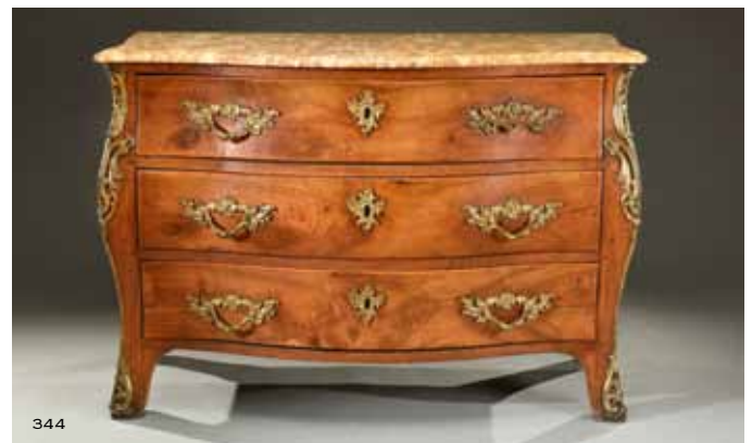
Illustration page 41