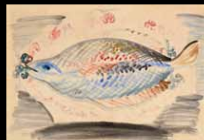
Raoul Dufy (1877 - 1953) La Barbue , 1924