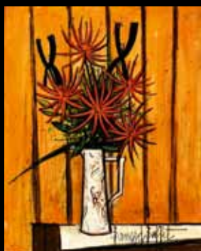
Bernard Buffet (1928-1999) Dahlias et iris dans un pichet