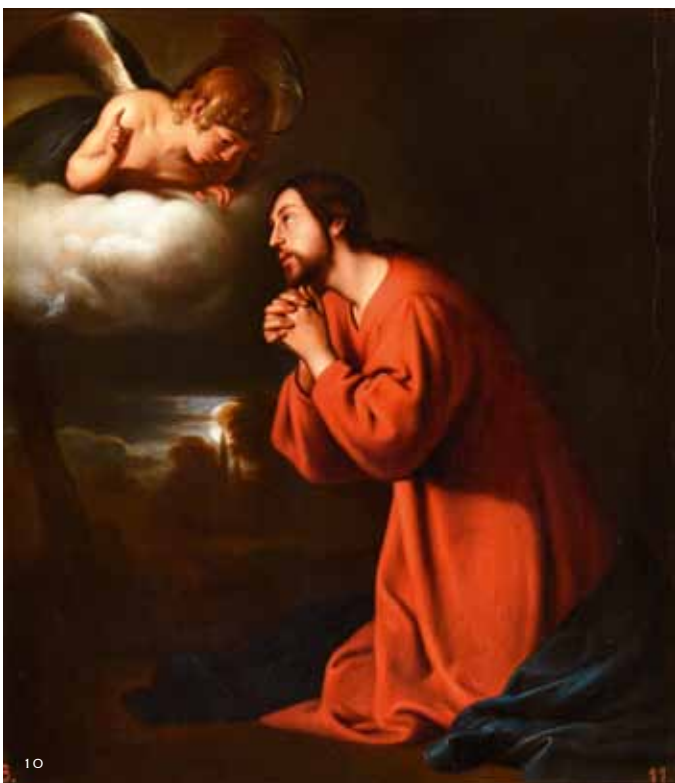
10 ATTRIBUÉ À GIOVANNI ANTONIO GALLI DIT SPADARINO (1585-1651/ 1653) La prière du Christ au jardin des oliviers Panneau 45 x 39 cm 6 000 / 8 000 €