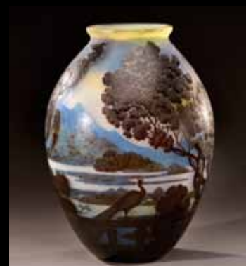
Gallé Vase à décor de lac de Côme