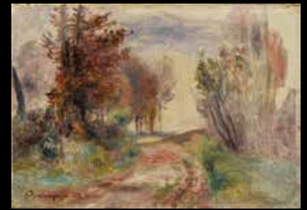
Auguste Renoir Chemin à la sortie d'un bois 145 000 €