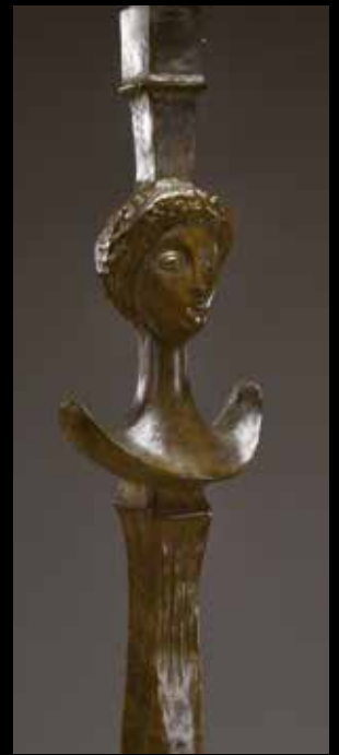
Alberto Giacometti Lampadaire "Tête de femme" en bronze 172 500 €

BIJOUX ET MONTRES, MODE ET VINTAGE MARDI 12 JUIN