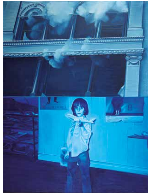
JACQUES MONORY (né en 1924). N.Y n°5 , 1971. Huile sur toile. 25 000 / 30 000 €