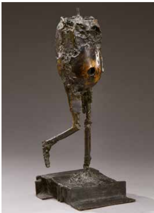
Nadine , 1964. Bronze soudé à patine brune. 20 000 / 25 000 €