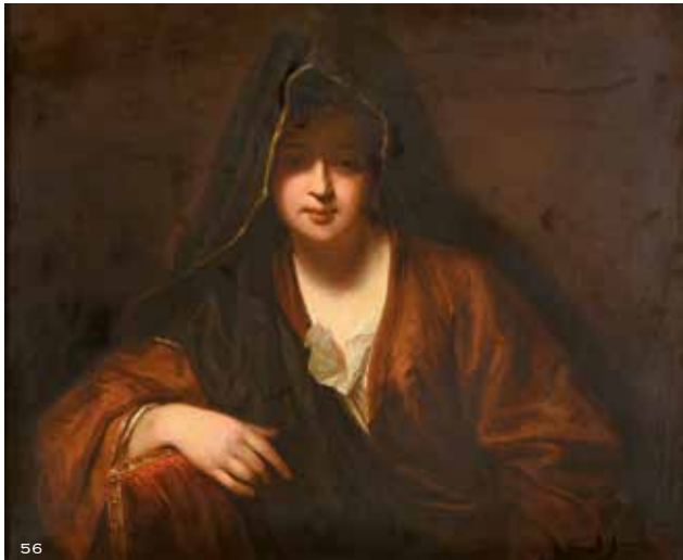
56 SANTERRE JEAN - BAPTISTE (ÉCOLE DE) 1651 - 1717. La Dame au voile dit aussi la Pèlerine.