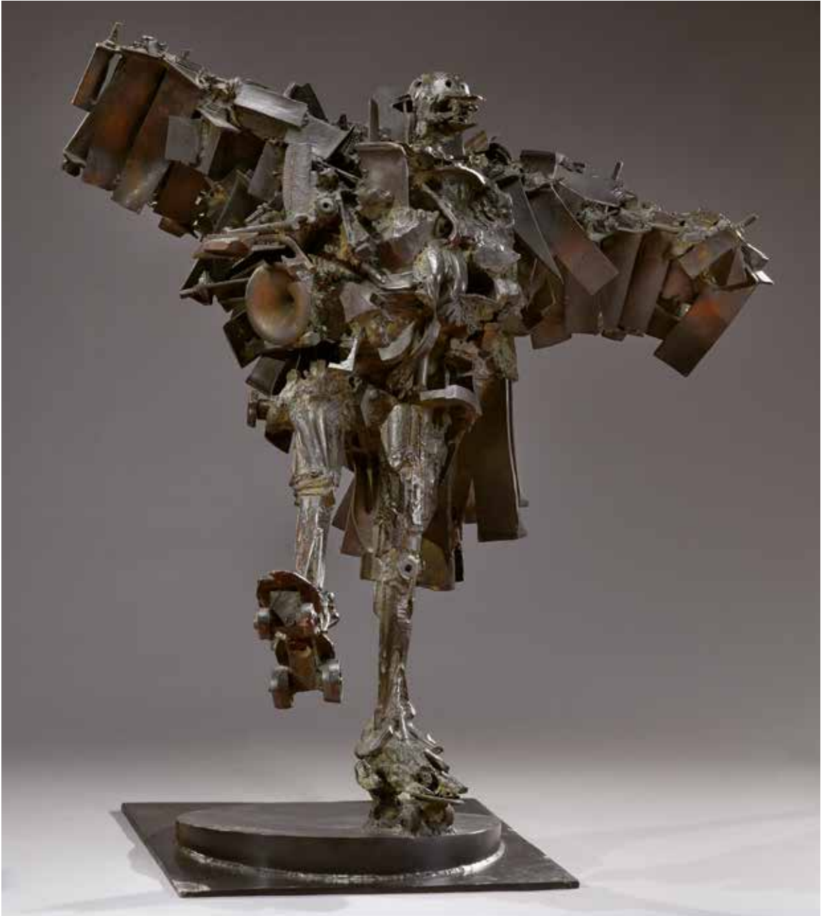
La Rambaud, 1987. Bronze soudé à patine brune. 120 000 / 150 000 €