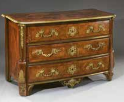
Hache à Grenoble Commode d'époque Régence 25 000 €