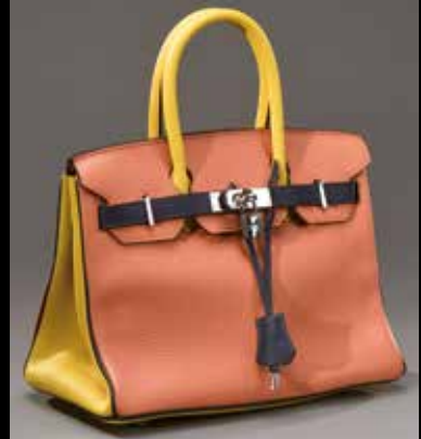
Hermès Paris Made in France Sac Birkin 30 cm 10 625 €

ART MODERNE ET CONTEMPORAIN COLLECTION DE M ME ET M. B. SAMEDI 7 AVRIL