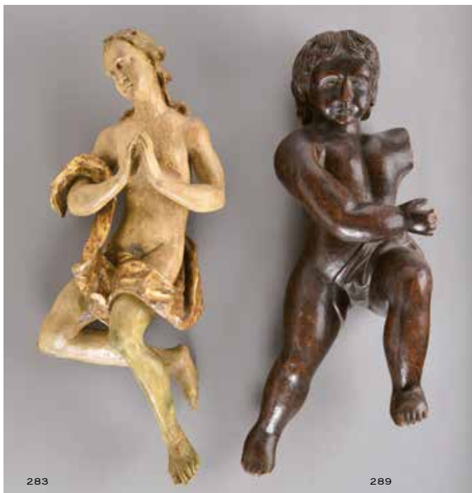
283 ANGE EN PRIÈRE , bois sculpté, doré et polychromé, représenté entouré d'un drapé. XVIII ème siècle. H. 60 cm. Accidents. 1 200 / 1 500 €