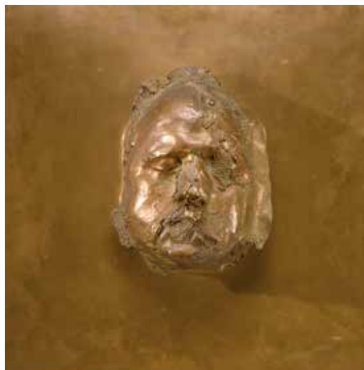
Autoportrait Bronze à patine dorée. 2 000 / 3 000 €