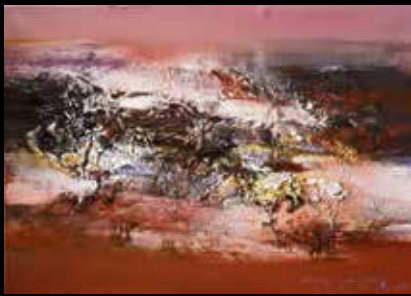
Wang Yan Cheng Abstraction lyrique, 2010 71 250 €