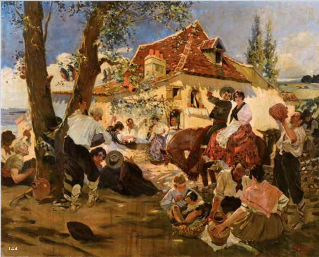
144 TITO SALAS (1887/88-1974). Fête gitane , 1917. Huile sur toile. 92 x 116 cm. Accidents. 8 000 / 12 000 €