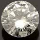
Diamant demi taille 3,23 carats 15 000 €