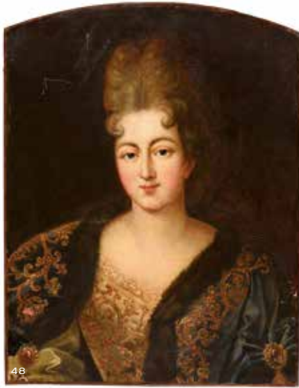
48 VIGNON CLAUDE - FRANÇOIS (ÉCOLE DE) 1633 - 1703. Portrait présumé de Françoise Marie de Bourbon (1677-1749), fille de Louis XIV et de Madame de Montespan, dite la seconde Mademoiselle de Blois. Elle est vêtue d'une robe bleue à col de fourrure brodée de riches rinceaux en fils d'or et ornée d'agrafes de diamants. Huile sur toile de forme légèrement cintrée dans la partie supérieure (rentoilage ; restaurations ; petits manques et griffures. Ancien vernis encrassé). H. 50 - L. 42 cm. 400 / 500 €