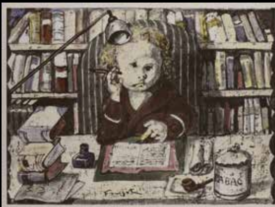
Cocteau-Fujita La Mésangère, un volume 8 750 €