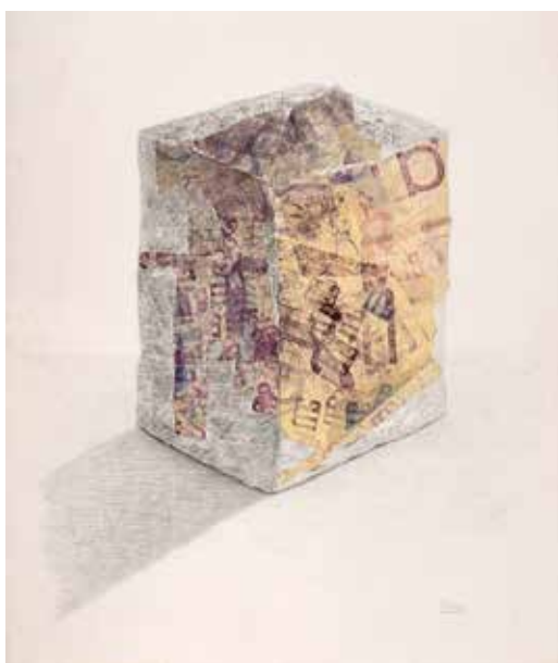
Portrait de compression Mine de plomb, tampons à l'encre, collage de papier sur carton peint. 2 000 / 3 000 €