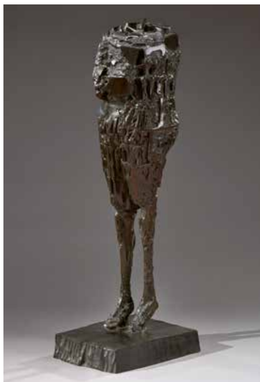
Buste aux jambes fines , 1959/1988. Bronze à patine brune. 50 000 / 70 000 €